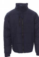
AZUL MARINO DE VESTIR